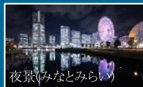
夜景(みなとみらい)