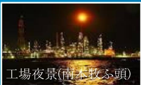
工場夜景(南本牧ふ頭)