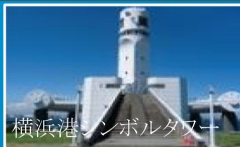
横浜港シンボルタワー