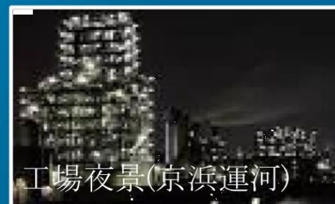
工場夜景(京浜運河)