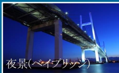
夜景(ベイブリッジ)